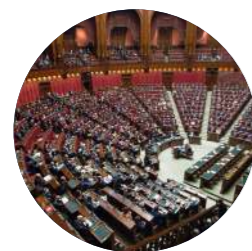
International : enjeux climatiques et Justice sociale