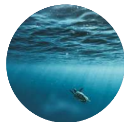
Rivières et océans